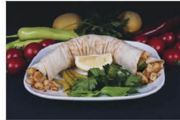
Tavuk Dürüm Tantuni