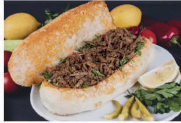
Ekmek Arası Et Tantuni