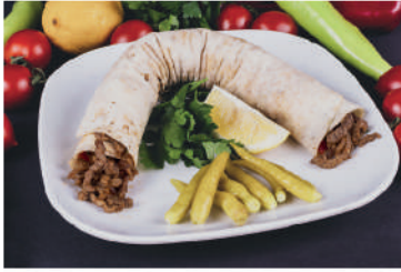
Et Dürüm Tantuni