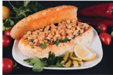
Ekmek Arası Tavuk Tantuni