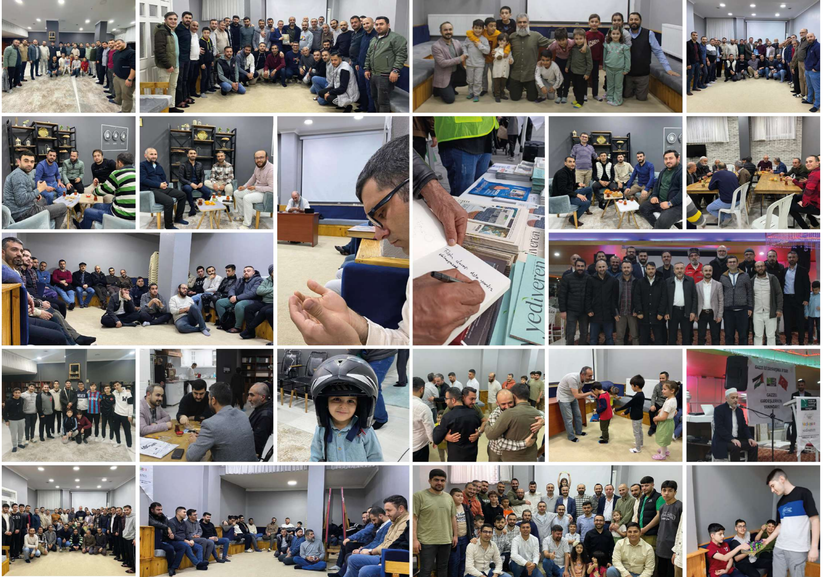
Cuma Sohbetleri - Bayramlaşma - Lise ve Ortaokul Buluşmaları - Gazze İle Dayanışma İfarı - Gazze'ye Destek Çadırı